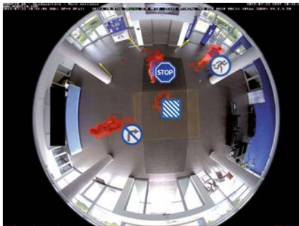
Optionale Videoanalyse MxAnalytics