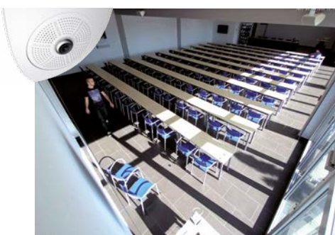
Korrigierte Ansicht mit 103°-Premiumobjektiv (B036)

Die 6MP-Indoor-Modelle c25 und p25 sind innerhalb von Minuten in abgehängten Decken, ähnlich wie ein Halogenstrahler, einfach installiert. Für jedes Indoor-Modell ist ein Aufputz-Set verfügbar und erlaubt so die Installation auf jedem Untergrund.